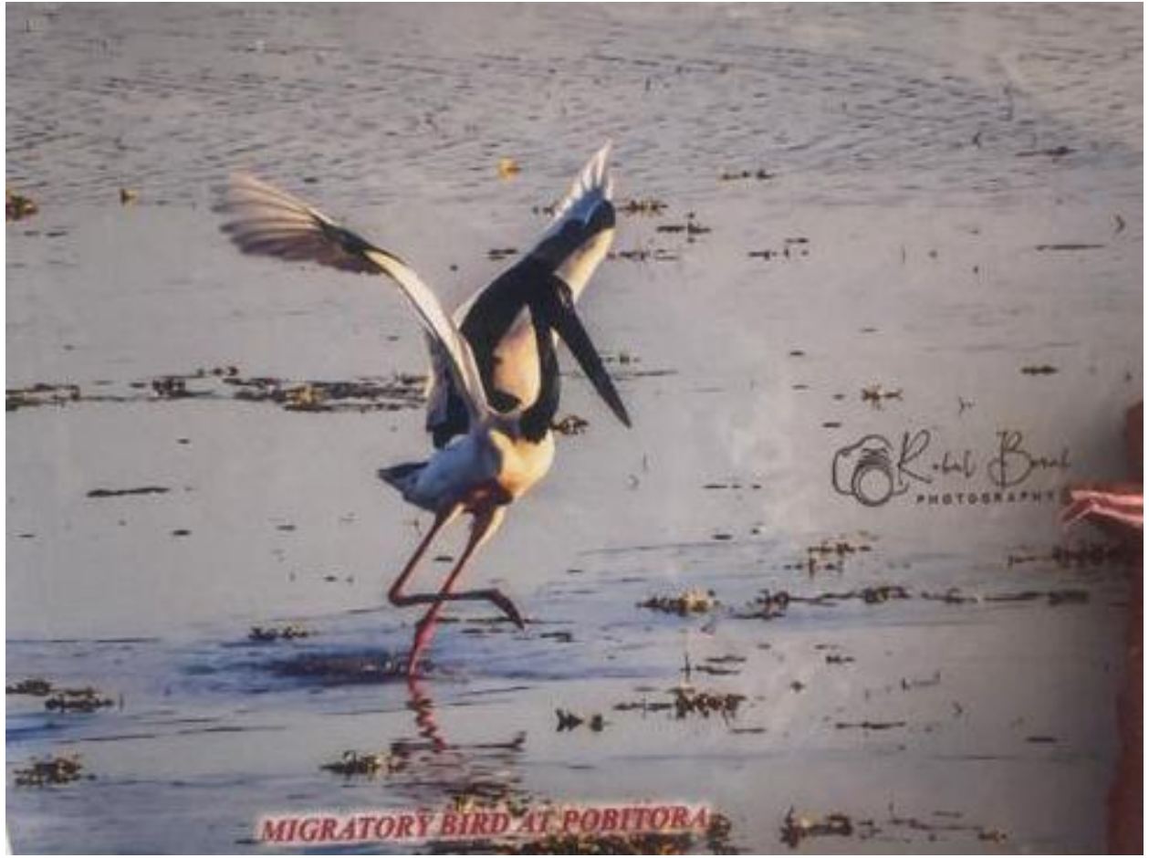
MIGRATORY BIRD AT POBITORA